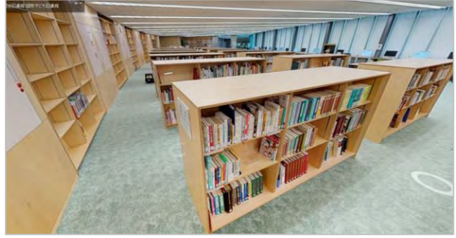
▲360度、室内を自由に見渡せる3Dビュー（左：子どものへや 右：児童書研究資料室）