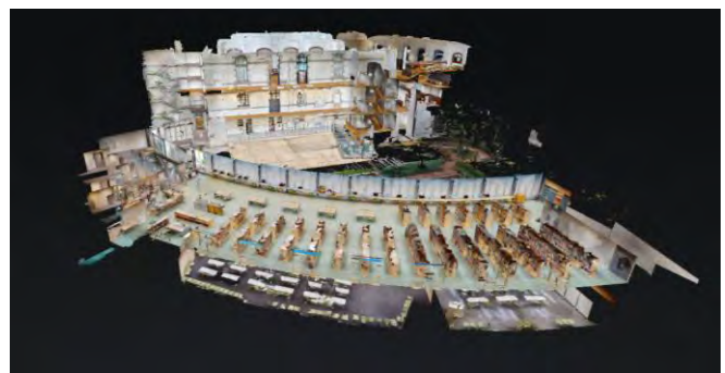
▲館内全体を俯瞰で見渡せるドールハウスビュー（左：レンガ棟 右：アーチ棟）